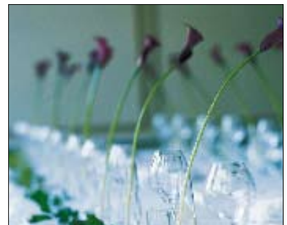
Vi anordnar er kongress, konferens eller fest