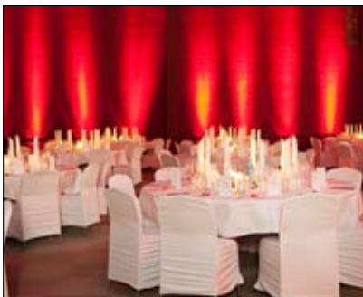
Kapacitet för upp till 900 personer