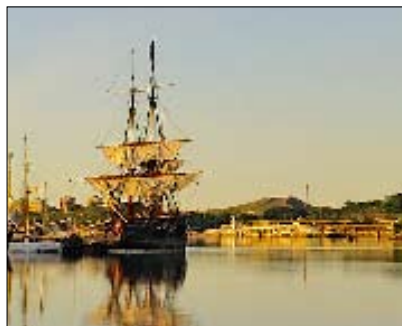
Vackert beläget vid Stockholms inlopp