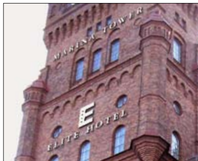
Kulturminnesmärkt med vackra tornrum